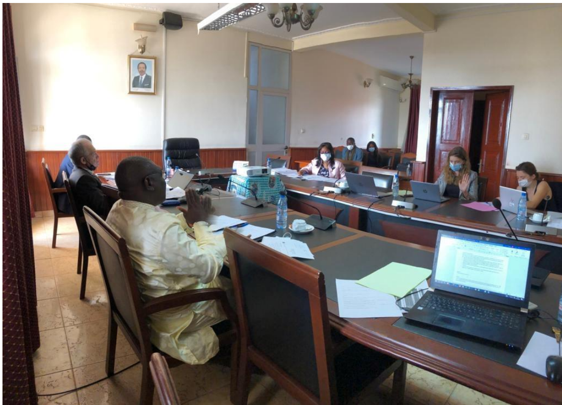
Séance de travail entre les membres de la PCFV avec les équipes de l'AFD et celles du STADE-C2D.

Une dynamique de concertation permanente qui s'illustre par une dizaine de réunions entre les membres ou avec l'AFD et le STADE pour affiner activités.