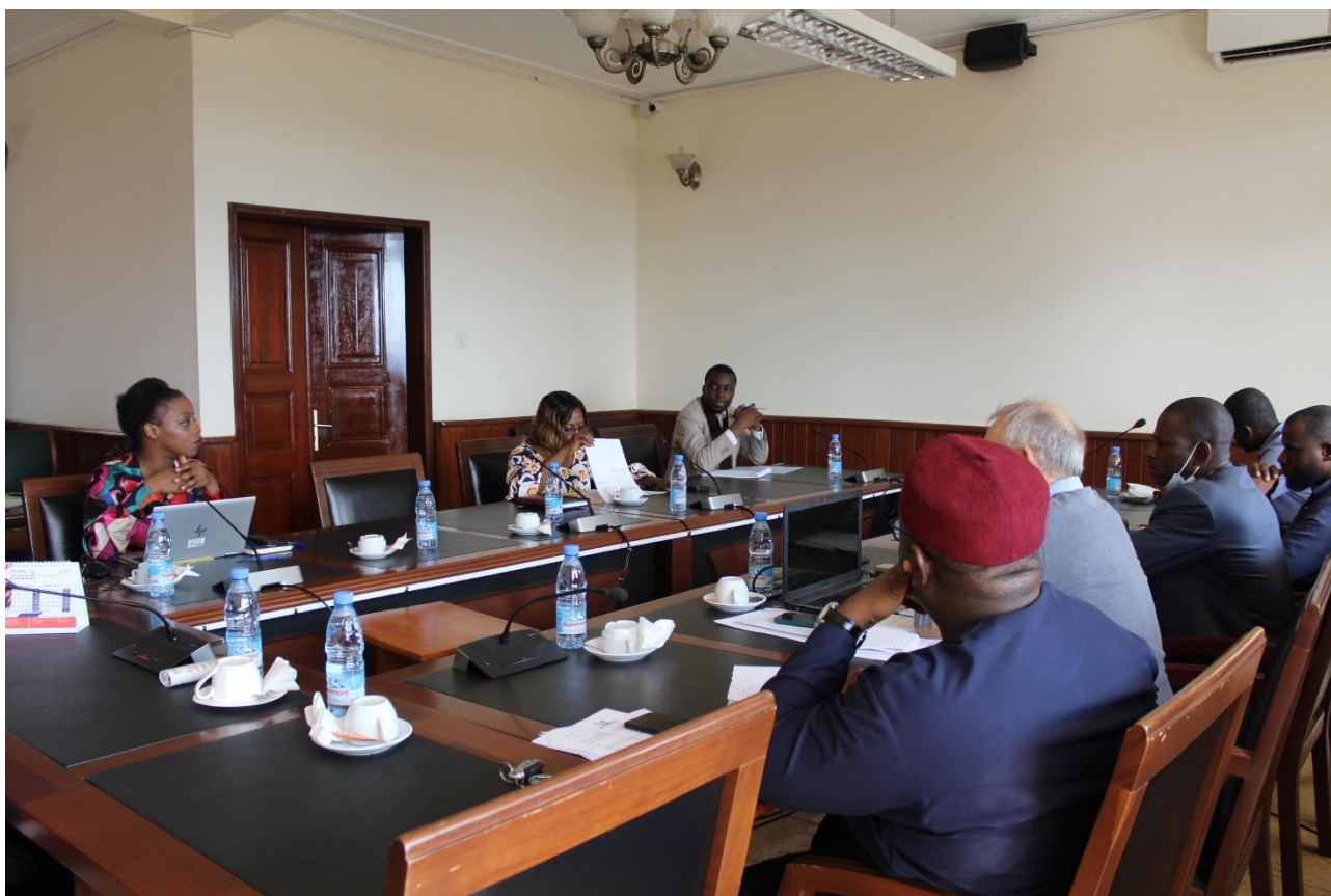
Les membres de la PCFCV en réunion de concertation avec les équipes de l'AFD ainsi que celles du STADE-C2D

En 2022 comme précédemment en 2021, cette ambition n'a pas pu être réalisée car malgré les besoins exprimés par des sectoriels.