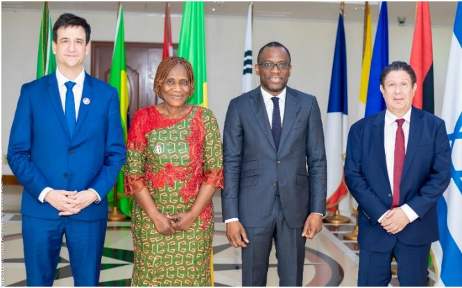
Rencontre avec le ministre des Affaires Etrangères M. Olushegun ADJADI BAKARI (3 ème à partir de la gauche)