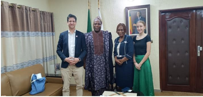
Echanges avec le maire de la ville de Porto-Novo, M. Charlemagne YANKOTY