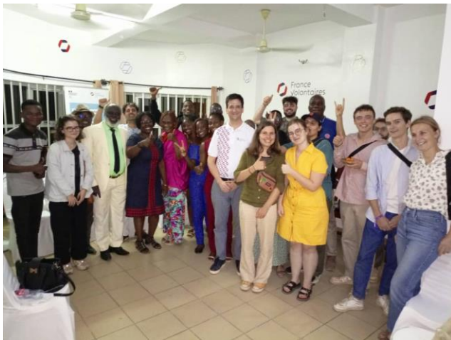
Rencontre de volontaires et responsables de structures à Cotonou