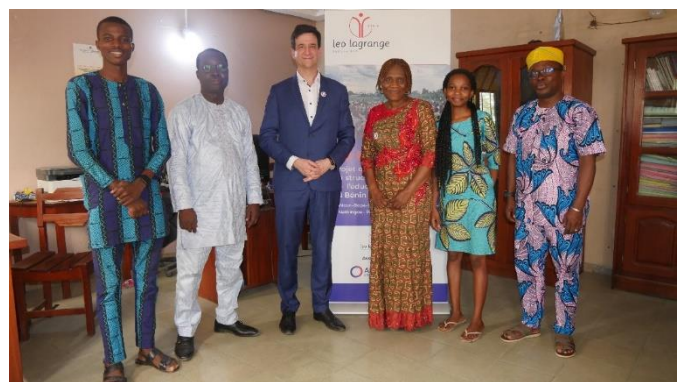
La visite de l'association Léo Lagrange Bénin à Cotonou