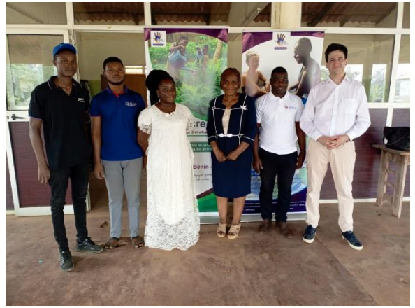
Rencontre avec les bénévoles de l'ONG JESPD à Porto-Novo