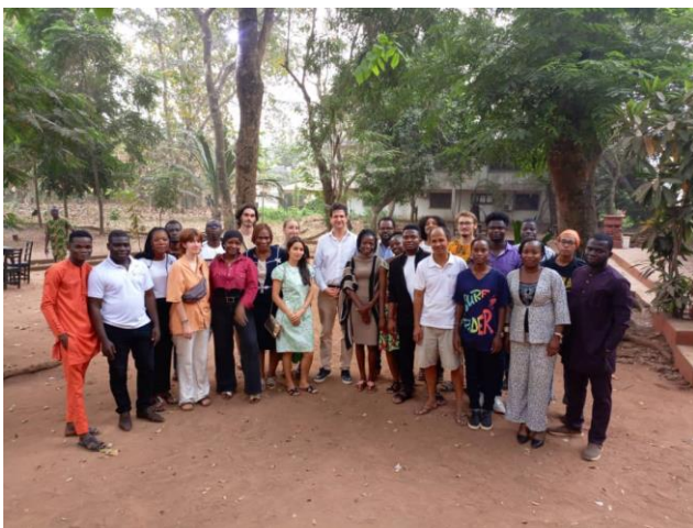
Rencontre avec les volontaires et responsables de structures à Porto-Novo