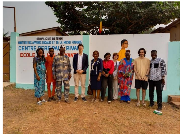
La visite du Centre Pierre Paul Rival à Adjohoun