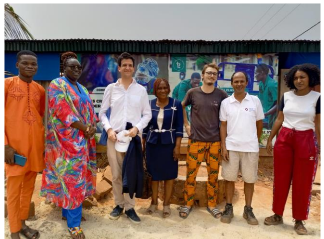
Visite de l'ONG GBOBETO à Porto-Novo