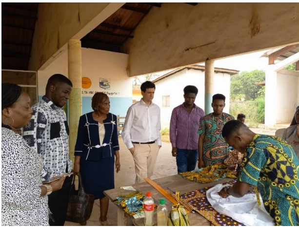
Un artisan tailleur du Laboratoire d'Innovations Sociales (LABIS) de Solidarité Laïque à Porto-Novo